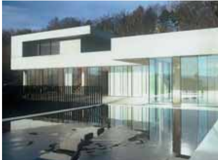
Baujahr: 2003 Objekt: Einfamilienhaus Architekt: Peter Kunz Architektur, Winterthur CH Standort: Winterthur CH