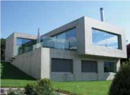
Baujahr: 2005 Objekt: Einfamilienhaus Architekt: Beck + Oser, Basel CH Standort: Hofstetten CH