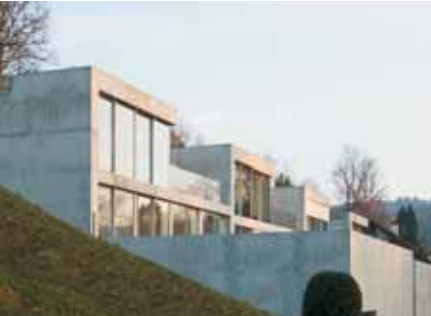
Baujahr: 2005 Objekt: Mehrfamilienhaus Architekt: Peter Kunz Architektur, Architekt FH/BSA, Winterthur CH Standort: Winterthur CH