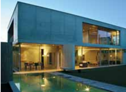
Baujahr: 2006 Objekt: Einfamilienhaus Architekt: Attilio Panzeri, Lugano CH Standort: Lugano-Sorengo CH