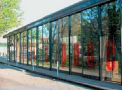
Baujahr: 2005 Objekt: Restaurant Architekt: Riehle + Partner, Reutlingen D Standort: Metzingen D