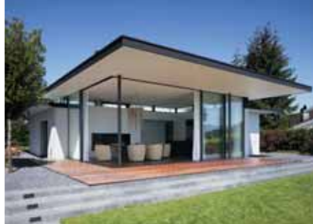
Baujahr: 2006 Objekt: Einfamilienhaus Architekt: Meier Architekten, Zürich Standort: Zürichsee CH