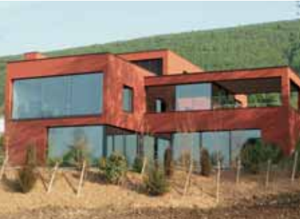
Baujahr: 2006 Objekt: Einfamilienhaus Architekt: Eggenschwiler AG Architekten ETH/SIA, Laufen CH Standort: Châtillon CH