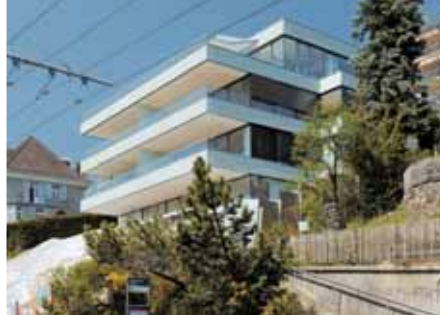
Baujahr: 2006 Objekt: Mehrfamilienhaus Architekt: Leutwyler Partner, Zug CH Standort: Zürich CH