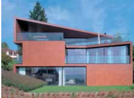
Baujahr: 2004 Objekt: Einfamilienhaus Architekt: Wild Bär Architekten AG, Zürich CH Standort: Küsnacht ZH, CH