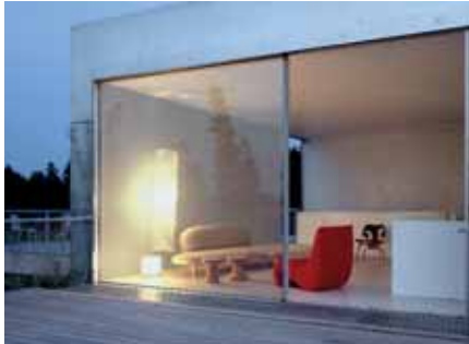
Baujahr: 2004 Objekt: Haus der Gegenwart Architekt: Allmann Sattler Wappner, Architekten, München D Standort: München D