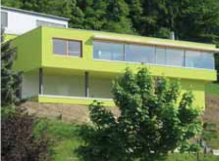
Baujahr: 2005 Objekt: Einfamilienhaus Architekt: Hopf Silke & Wirth Toni, Winterthur CH Standort: Mühlethal CH