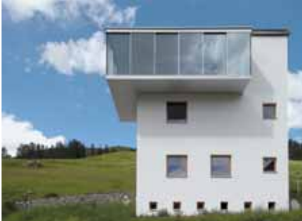
Baujahr: 2006 Objekt: Einfamilienhaus Architekt: Roger Vulpi, Guarda CH Standort: Guarda Engadin CH