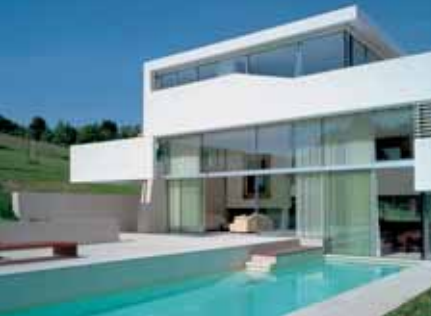
Baujahr: 2005 Objekt: Einfamilienhaus Architekt: Project A.01 Architects ZT GmbH, Wien A Standort: Klosterneuburg A